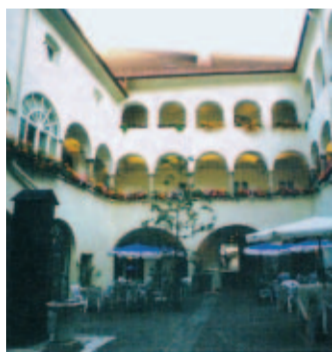
6: Bamberger Hof

Eine der beiden Verkehrslinien, an denen Herzog Bernhard die Stadt gründete. Ein Teilstück des Ost-West-Verkehrsweges, der sich hier mit dem nord-südlichen kreuzte (siehe Wiener Gasse). Arkadenhöfe in den Häusern Nr. 1, 4, 5, 16, 22, 24, 31 (siehe Goldene Gans), 33, 34, 35. Weitere kunsthistorisch und stadgeschichtlich wichtige Häuser: Nr. 1 (Altes Rathaus – siehe Punkt 20), 2, 3, 4, 6, 7, 8, 9, 10, 16, 22, 29 (Stiegenhaus), 33. Am Ende des Alten Platzes – Ostseite – Gedenktafel der Landstände. Haus Nr. 19: Erbaut um 1600, Haus des deutschen Ritterordens (1829 – 1862), Renaissanceinnenhof. Haus Nr. 21: Ehemaliges Landesvizedomhaus mit Stuckfassade aus 1730, Renaissance-Arkadenhof (Eingang über Renngasse 7). Haus Nr. 22: Einst Haus des Hochstiftes Bamberg (1614–1759), Fassade 19. Jahrhundert, Renaissance-Arkadenhof mit Fassade um 1650, Passage zur Renngasse. Haus Nr. 24: Haus „Blaue Kugel“, stand bereits 1605, Erstbesitzer Wolf Siegmund Freiherr von Sigersdorf (1659), schöner Arkadenhof.