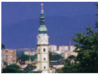
18: Stadtpfarrkirche mit Glockenspiel Besichtigung möglich!

20 Altes Rathaus Einst Palais Welzer, heute Palais Rosenberg, erbaut um 1600. Sehenswert Arkadenhof und das Rosenberg-Wappen über dem Hauptportal, das Fromiller-Gemälde von Justitia mit Wappen von Stadt und Land.