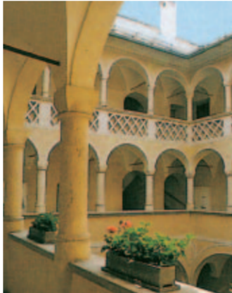
20: Innenhof, Altes Rathaus

22 Bäckerjunge In Höhe des ersten Stockes ein Steinkopf, Ursprung keltisch bzw. frühmittelalterlich.