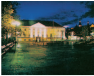
1: Das Klagenfurter Rathaus im Lichterglanz

1 Rathaus Seit 1918 in dieser Funktion. Ein 1650 errichtetes Renaissance-Palais der Grafen Rosenberg mit interessantem Stiegenaufgang.